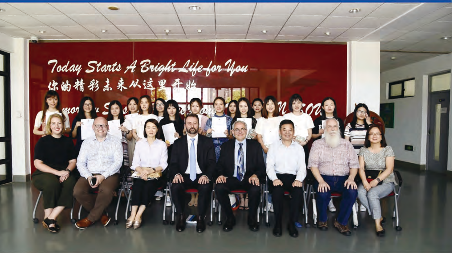
2018年6月14日 塔斯马尼亚大学Dean's Roll(院长名录优秀生)颁奖礼合影

TODAY STARTS A BRIGHT FUTURE FOR YOU TOMORROW SEES ONE MORE HONOR FOR AIEN-SHOU