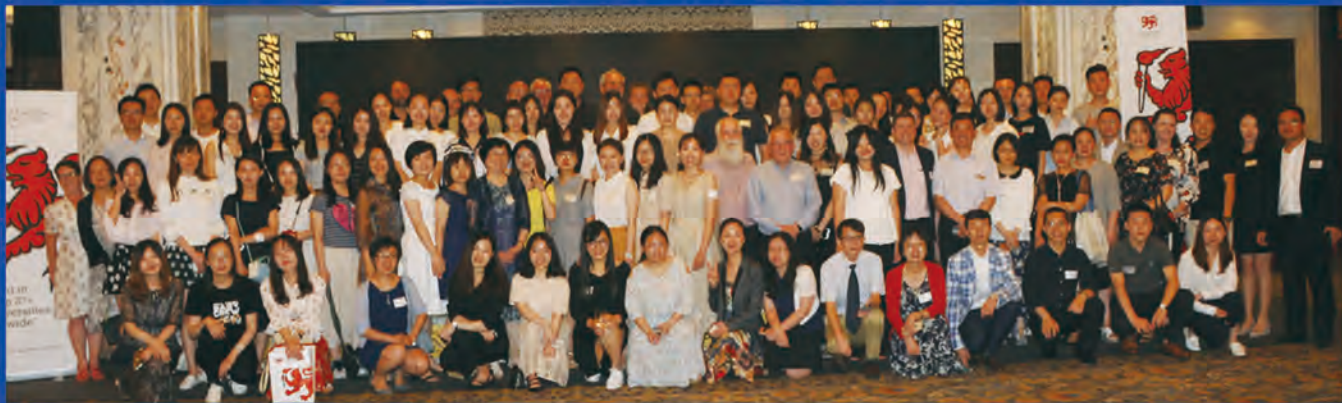
（2018年6月16日塔斯马尼亚大学在上海召开校友会合影）